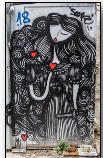
Ακόμα μερικές φωτογραφίες του Αντρέα Ιακώβου