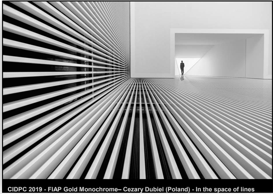
CIDPC 2019 - FIAP Gold Monochrome— Cezary Dubiel (Poland) - In the space of lines